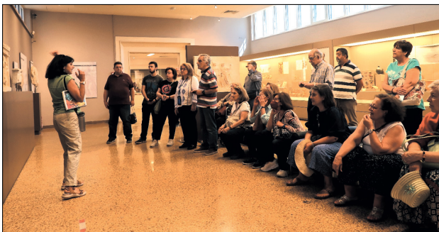
Τα μέλη του Συλλόγου κατά την ξενάγηση στο Μουσείο.

Σύμφωνα με τον μύθο μία αρκούδα (άρκτος) που ζούσε στο ιερό της θεάς στη Βραυρώνα τραυμάτισε ένα μικρό κορίτσι και τα αδέρφια του κοριτσιού τη σκότωσαν. Η Αρτεμεις εξοργίστηκε και έστειλε λοιμό στην πόλη της Αθήνας. Για να εξευμενιστεί η θεά και να σταματήσει η καταστροφή, σύμφωνα με χρησμό, οι παρθένες της πόλης έπρεπε στο εξής να υπηρετήσουν την Αρτέμιδα για ένα διάστημα πριν το γάμο τους.