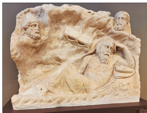
Η αραγή των όπλων του Φιλοκτίτη.

Στην αίθουσα 4 παρουσιάζονται αφιερώματα-προσωπικά αντικείμενα των γυναικών προς τη θεά με αφορμή το γάμο τους ή τη γέννηση των παιδιών τους: πυξίδες, μεταξύ των οποίων λίθινες και ξύλινες, που χρονολογούνται από τον 9ο έως τον 4ο αι. π.Χ. και προορίζονταν για τη φύλαξη ειδών καλλωπισμού και κοσμημάτων, αρωματοδοχεία, κυρίως ληκύθια και αλάβαστρα του 6ου και του 5ου αι.π.Χ., κοσμήματα και χάλκινα κάτοπτρα, με χαρακτηριστικότερο το ενεπίγραφο κάτοπτρο της Ιππύλας. Επίσης εκτίθενται προσωπικά αντικείμενα των άρκτων, παιχνίδια κλπ.