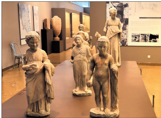
Η πομπή των μικρών άρκτων. Στην πρώτη σειρά αριστερά η μικρή άρκτος χαμογελά, πράγμα σπάνιο σε άγαλμα.

Η ξενάγησή μας ξεκίνησε από το Μουσείο. Στη νέα μόνιμη έκθεση, που αποδόθηκε στο κοινό το 2009, προβάλλονται σύμφωνα με τις σύγχρονες μουσειολογικές και μουσειογραφικές μεθόδους τα πλούσια και ποικίλα ευρήματα από την ανασκαφή του ιερού της Βραυρώνας, καθώς και αρχαιότητες από την ευρύτερη περιοχή της Μεσογαίας. Το μουσείο αναπτύσσεται σε ένα επίπεδο και αποτελείται από τον προθάλαμο και πέντε αίθουσες. Τα εκθέματα του μουσείου χρονολογούνται από την Πρώιμη Εποχή του Χαλκού έως και τη Ρωμαϊκή Εποχή.