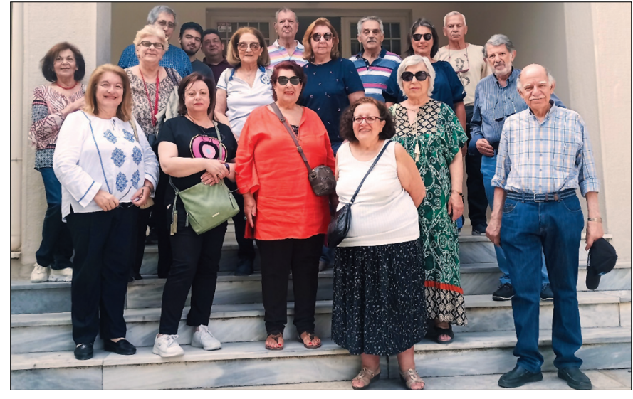
Τα μέλη μας μπροστά στο Μουσείο