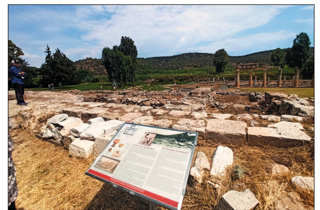
Ο Ναός της Αρτέμιδος

Εκτός από το ναό της Αρτέμιδος και τον παρθενώνα –που μάλλον ήταν η μεγάλη στοά βορειώς του ναού– τα υπόλοιπα κτήρια δεν έχουν ακόμη βρεθεί.